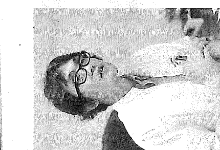
日本医科大武蔵小杉病院腫瘍内科教授。国立がん研究センター中央病院医長などを歴任。著書に「医療否定本の嘘」。

「抗がん剤」について、どんなイメージをお持ちでしょうか。がんの治療手段として、医師から抗がん剤を提案されたとき、患者としては「これのがんを治すんだ」と考えたくありません。でも、抗がん剤で期待できる効果は、がんの種類によって大きく異なります。血液のがんの多くは抗がん剤によって治療を望むこともできず、気や免疫力の低下といった副作用も伴います。